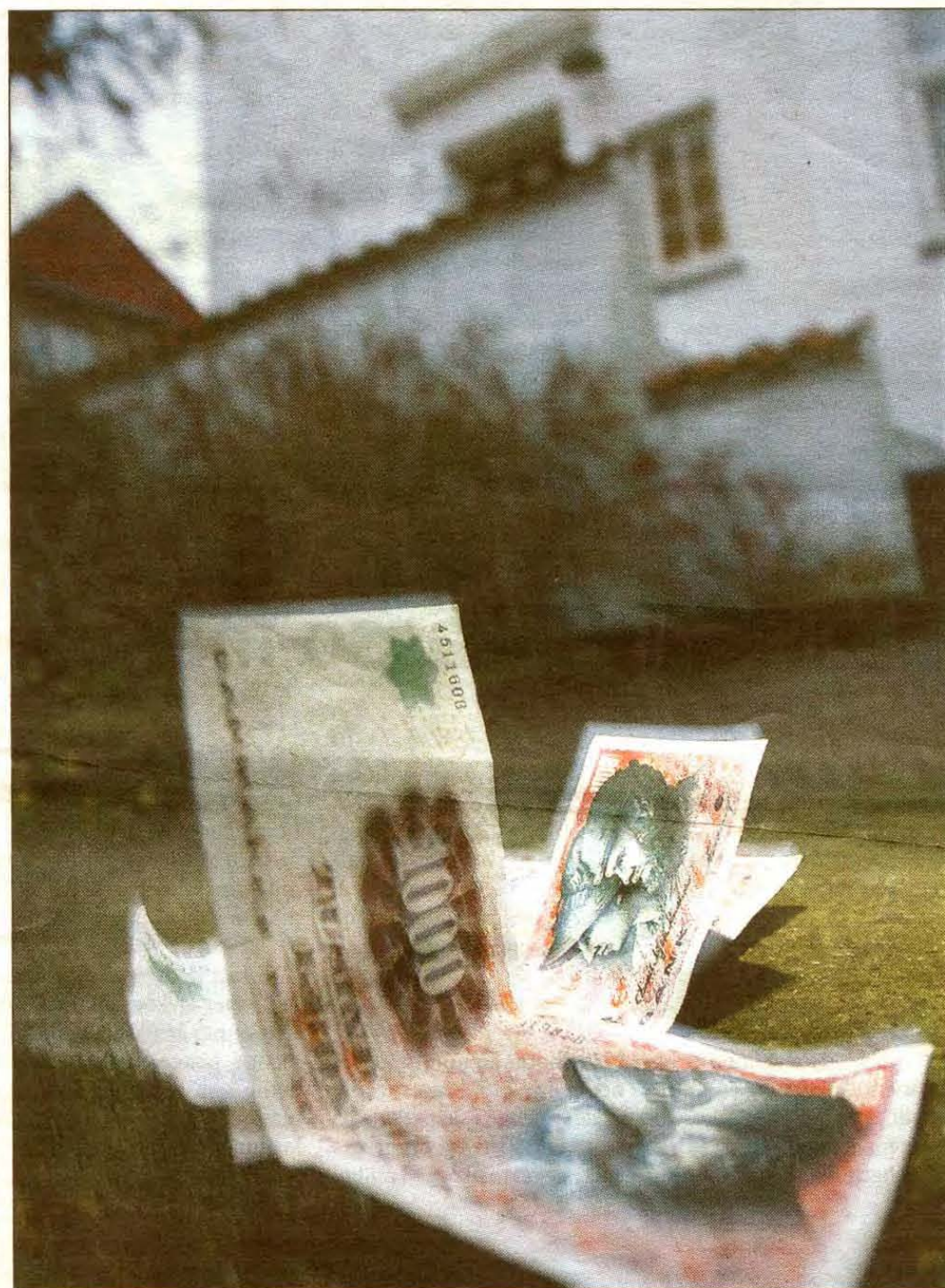
Hørsholm skærper kursen overfor borgere, der skylder kommunen penge. Kommunen vil tvinge skyldnere til at belåne deres friværdi i boligen.