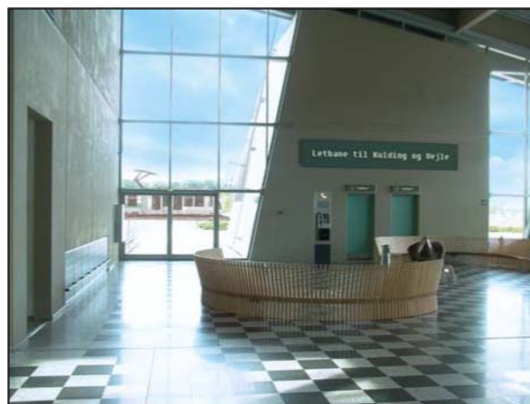
Billund lufthavnsterminal med letbaneforbindelse.

At Billund desuden er hjemsted for Legoland samt et kommende Adventure Center gør ikke det forventede trafikgrundlag mindre.