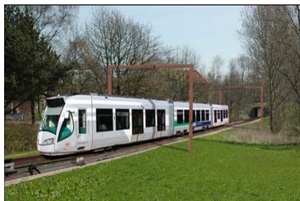
Undervejs – med et andet letbanetog (Regio Citadis fra Kassel, Tyskland)

Som udviklingen i Trekantområdet ser ud til at blive fremover, må det forventes, at udbygningen af boligområder vil foregå inde i landet, hvorfor en brugbar kollektiv trafik vil være med til at gøre disse områder mere attraktive som boligområder.