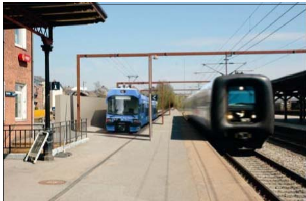
Så tæt kan man komme på Kolding station.

At forslaget desuden vil indebære mulighed for at løse nogle interne trafikproblematikker i Kolding Kommune gør ikke forslaget mindre interessant.