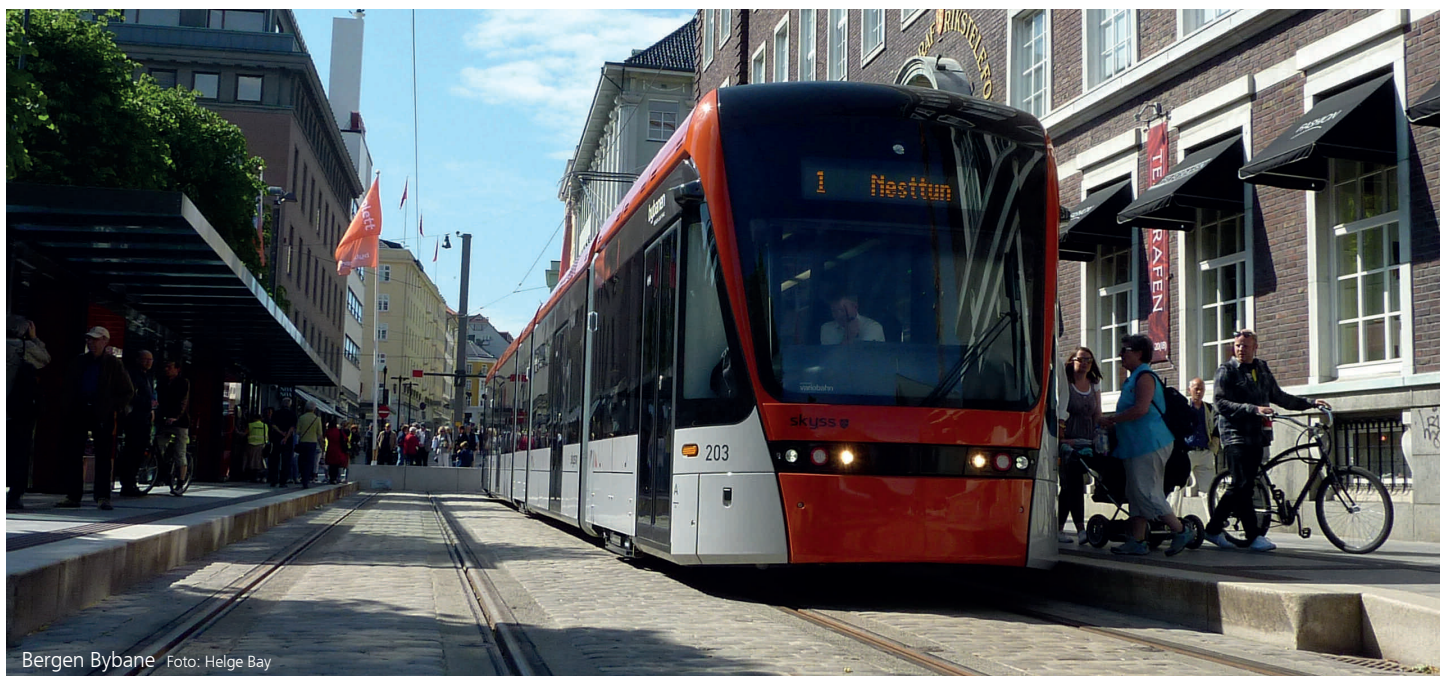
Bergen Bybane

En letbane er en moderne udgave af sporvognen, der kombinerer det bedste fra tog og bus. Letbanen kører gennem gaderne på skinner som et tog, men efter vejtrafikkens færdselsregler.