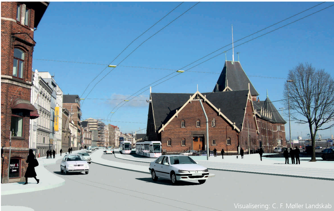
Visualisering: C. F. Møller Landskab