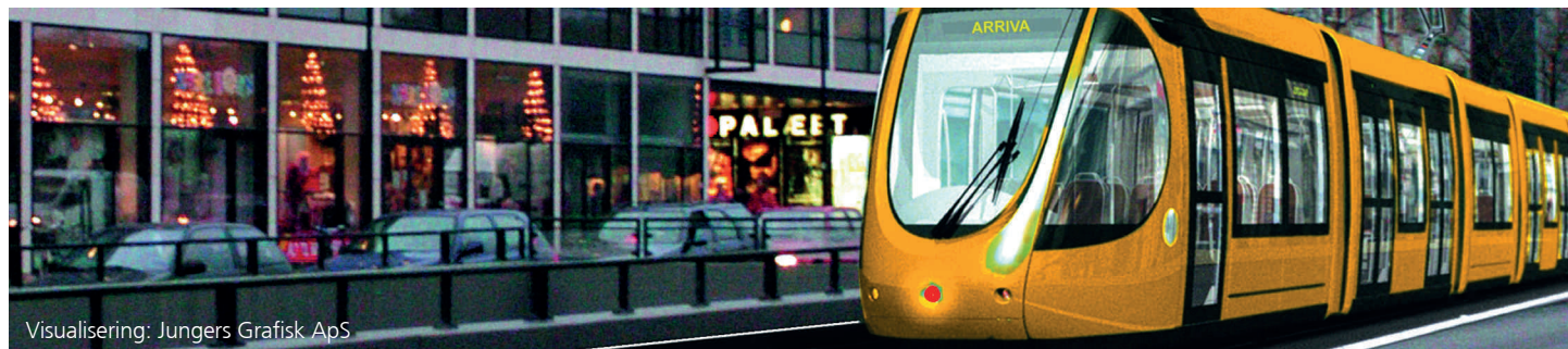
Visualisering: Jungers Grafisk ApS

d. 29.06.11 indgået en aftale med Region Hovedstaden og de 11 kommuner om en letbane i Ring 3. Det betyder grønt lys for en realisering af Storkøbenhavns første letbane mellem Lundtofte og Ishøj.