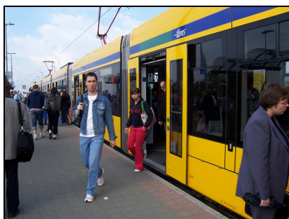
Standingssted med adgang uden trin i Budapest.

I byerne erstattes de mest benyttede buslinjer med letbaner, og på landsplan investeres der i højhastighedstog på elektrificerede jernbaner.