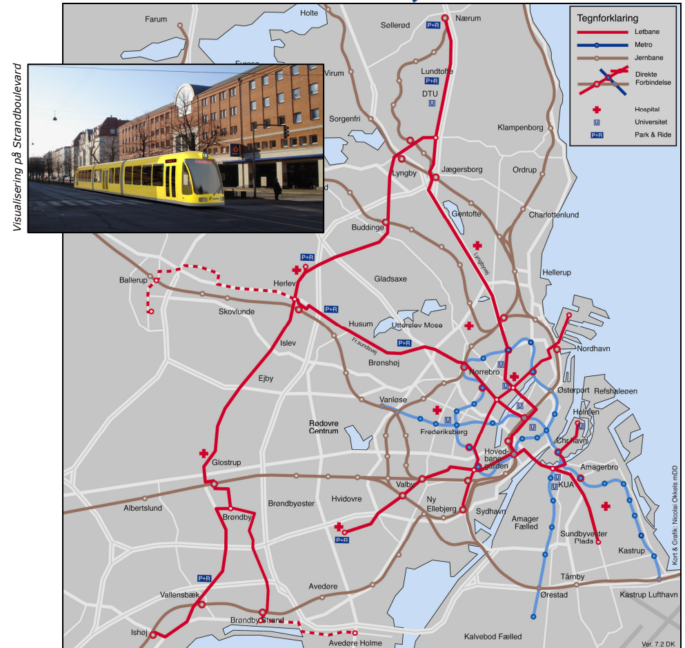
Visualisering på Strandbouleværd