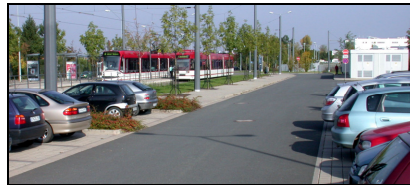
Parker og Rejs-anlæg i Erfurt, Tyskland.

Men de største rejsetidsfordele opnås især på de lange stræk uden for bykernen, hvor letbanen kører i vejmidten eller på en selvstændig jernbane.