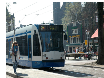
Moderne sporvogn i det centrale Amsterdam

I Frankrig har 16 byer allerede åbnet nye letbaner. Toulouse og Toulon åbner deres i 2010, Reims i 2011 og Brest i 2012. Derefter vil der være letbaner i 20 franske byer.