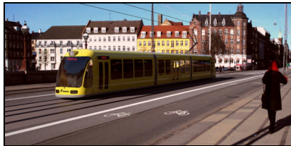
Visualisering af letbane på Dronning Louises Bro

Letbanearealet kan i bygader virke som en helle for krydsende forgængere. Risikoen for påkørsel er minimal, da der kører færre letbaner end biler og føreren har et godt udsyn og gode bremseegenskaber.