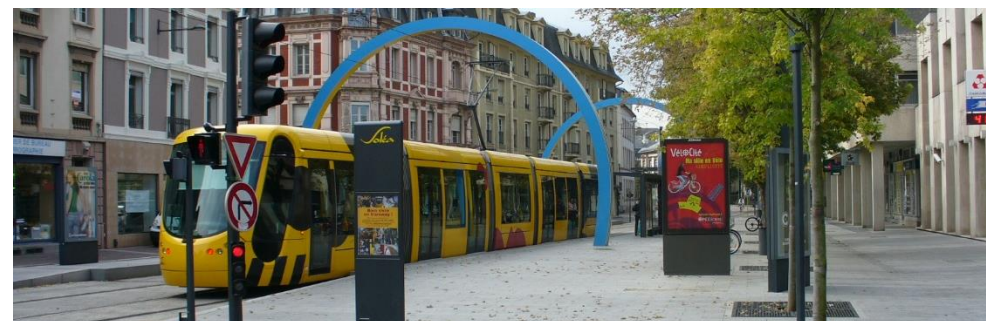
Mulhouse, Frankrig, foto: Axel Kuehn

De fleste bilejere vil ikke skifte til bus, men gerne til letbane. Det ses bl.a. på Skinnefaktoren: Skinner giver ca 25% flere passagerer.